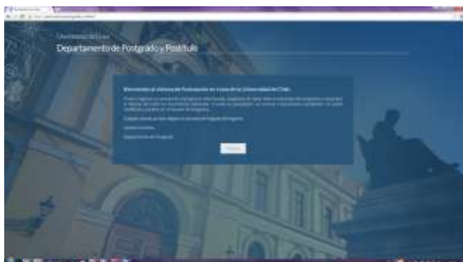
Figura 1: Página de bienvenida de Formulario de Postulación en línea